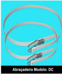
Abraçadeira Modelo: DC