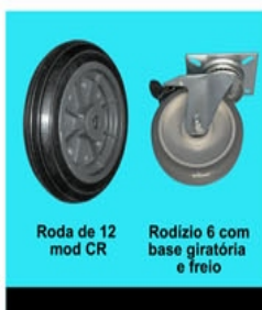
Roda de 12 mod CR