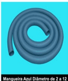
Mangueira Azul Diâmetro de 2 a 12