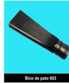
Bico de pato 803