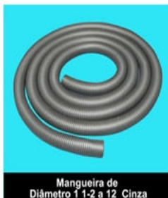
Mangueira de Diâmetro 1 1/2 a 1 1/2 Cinza