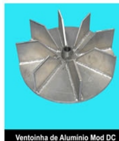
Ventoinha de Alumínio Mod DC