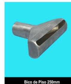
Bico de Piso 250mm