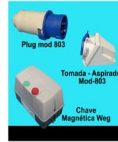
Plug mod 803