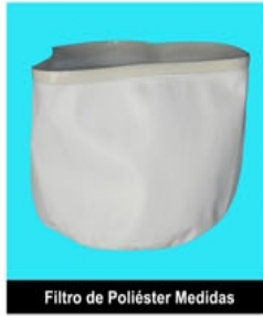
Filtro de Poliéster Medidas