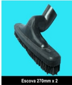
Escova 270mm x 2