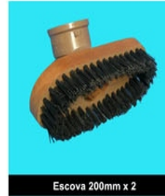
Escova 200mm x 2