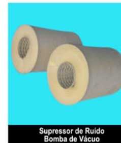
Supressor de Ruído Bomba de Vácuo