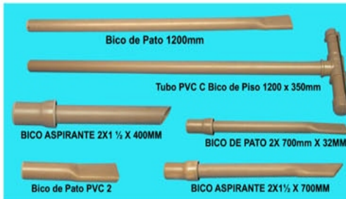
Bico de Pato 1200mm