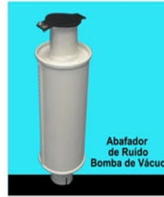
Abafador de Ruído Bomba de Vácuo