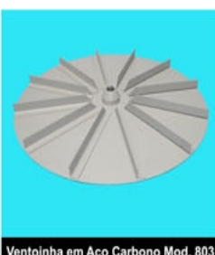
Ventoinha em Aço Carbono Mod. 803