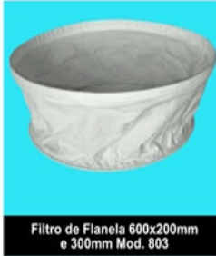
Filtro de Flanela 600x200mm e 300mm Mod. 803