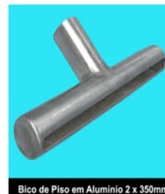
Bico de Piso em Alumínio 2 x 350mm