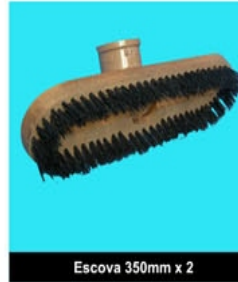
Escova 350mm x 2