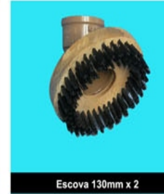
Escova 130mm x 2