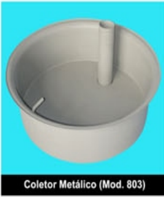
Coletor Metálico (Mod. 803)